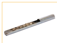
Schieber für Räucherchips Alimentateur à copeaux