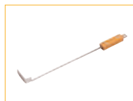
Ascheschieber Outil de nettoyage des cendres