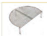
Grillrost-Erweiterung Grille de cuisson secondaire