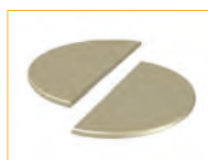
Hitzereflektor Réflecteur de chaleur